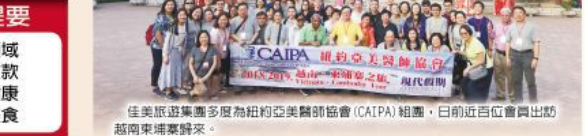
佳美旅遊集團多度為紐約亞裔醫師協會(CAIPA)組團，日前近百位會員出訪越南來埔峯遊學。

加拿大、菲律賓、希臘、聖托馬斯、也加地亞等。同時，該集團也代理世界各地出發的遊輪航線，為客量身訂製環球之旅。該集團可全年安排拉斯維加斯$228起，三天兩夜，2人成行。奧基藝術學院，可加約峽谷一日遊。 此外，佳美熱銷中的行程尚有：洛杉磯、舊金山、西雅圖、墨西哥、坎昆、瑪雅遺蹟、佛州奧蘭多、邁阿密、芝加哥、休士頓、紐奧良、加地海、波多黎各、古巴傳奇之旅、東非、南非豪情之旅、南美哥倫比亞、南美四國巴西、秘魯、阿根廷、智利、杜拜、阿聯酋共和國、日本-關東、關西、北海道、東南亞-泰國、星加坡、馬來西亞、越南、柬埔寨、吳哥窟、緬甸、以色列、約旦。 佳美熱銷歐洲豪華與中國經典遊以及世界各地特色旅遊，代訂機票，精辦中、臺與地簽證，各類公證，護照換新及加頁、承接來美簽證及遊學團，詳情請瀏覽網址：www.catsny.us或逕至該集團索取目錄，電話：135-27 40TH RD., #202, FLUSHING, NY 11354(台北酒莊2樓)，7天營業，電話：718-460-2628，通曉英、國、粵、滬以及溫州話等。